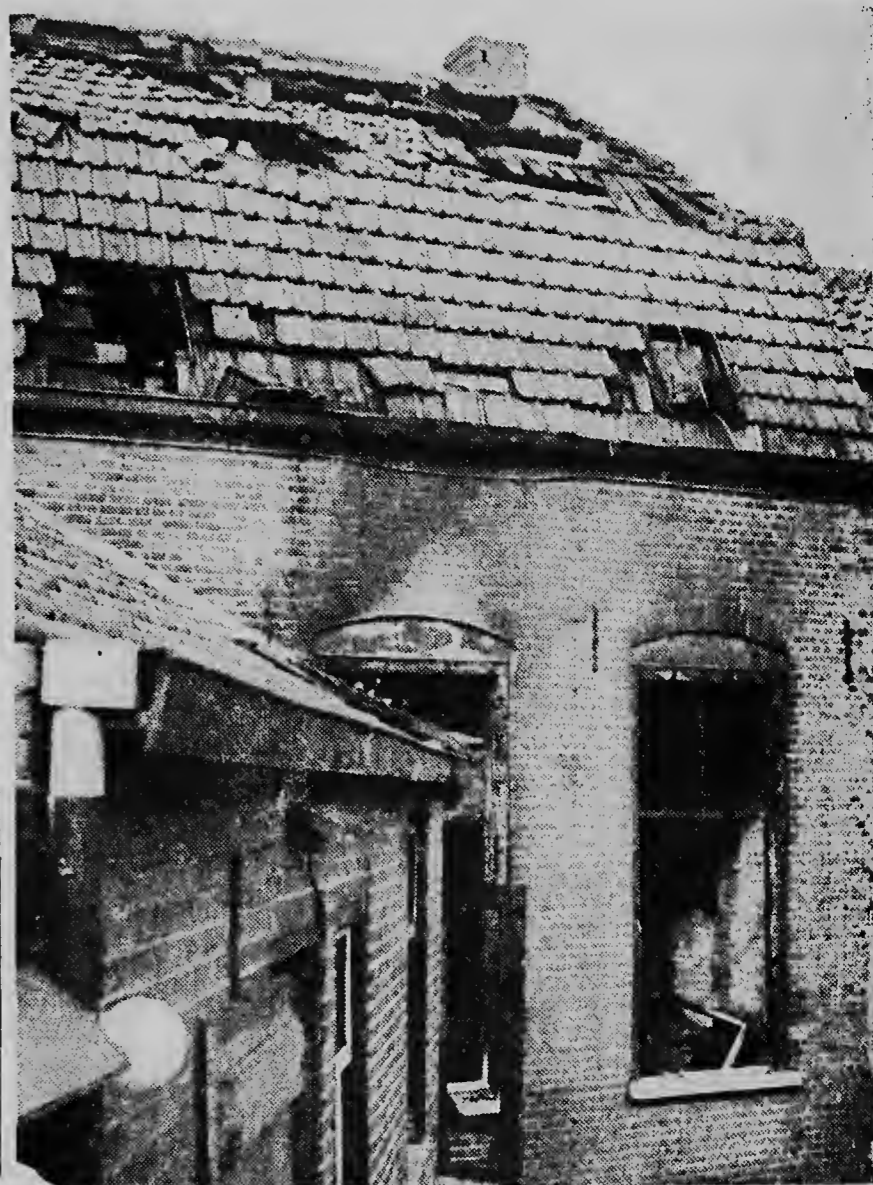
E foto aki ta duna un idea di e negoshi na St. Josephstraat na Tilburg, Hulanda, cu a pega na candela siman pasa ora cu e donjo y su casa tabata asemble cu e resultado „desastroso“ cu nan jiu di dos anja y mei a perde su bida den dje candela. Nan otro jiu di neube anja cu tambe tabata den e mes edificio si a scapa door cu un persona cu tabata pasa ei banda a salba su bida.

Den incendio na Tilburg un mucha a kima muri